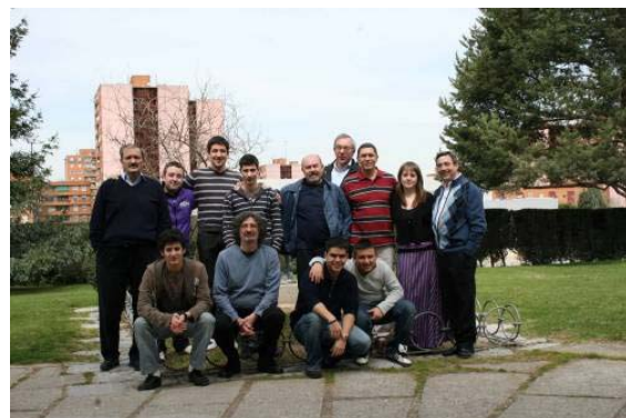
Algunos de los participantes en el I Torneo Clausura.