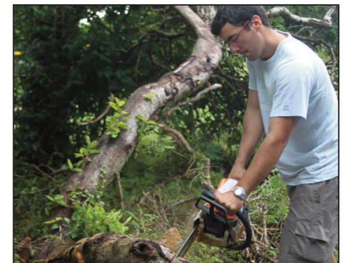
LA JORNADA DE TRABAJO DURABA TODA LA MAÑANA.