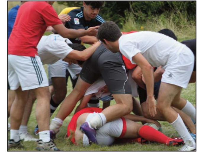
DEPORTE AUTÓCTONO EN BALLYGLUNIN.