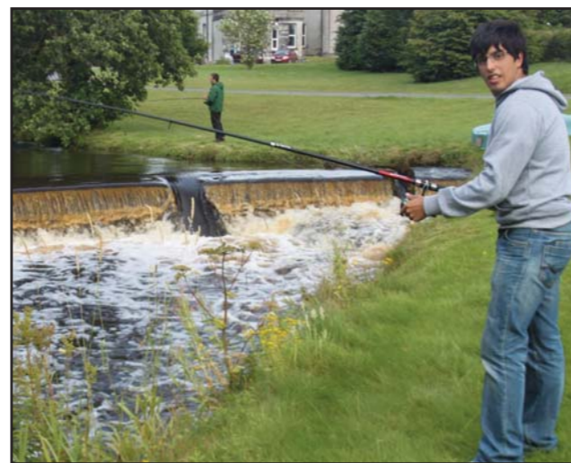
TARDES DE TRANQUILIDAD DESPUÉS DEL TRABAJO.