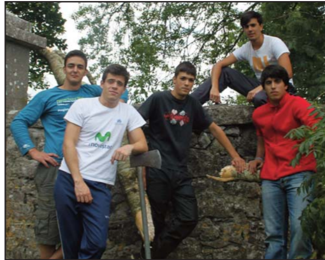
UN PARÓN EN EL TRABAJO PARA EL REPORTAJE FOTOGRÁFICO.