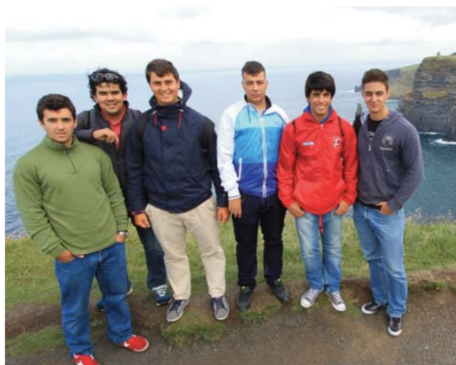
EN LOS CLIFFS OF MOHER.